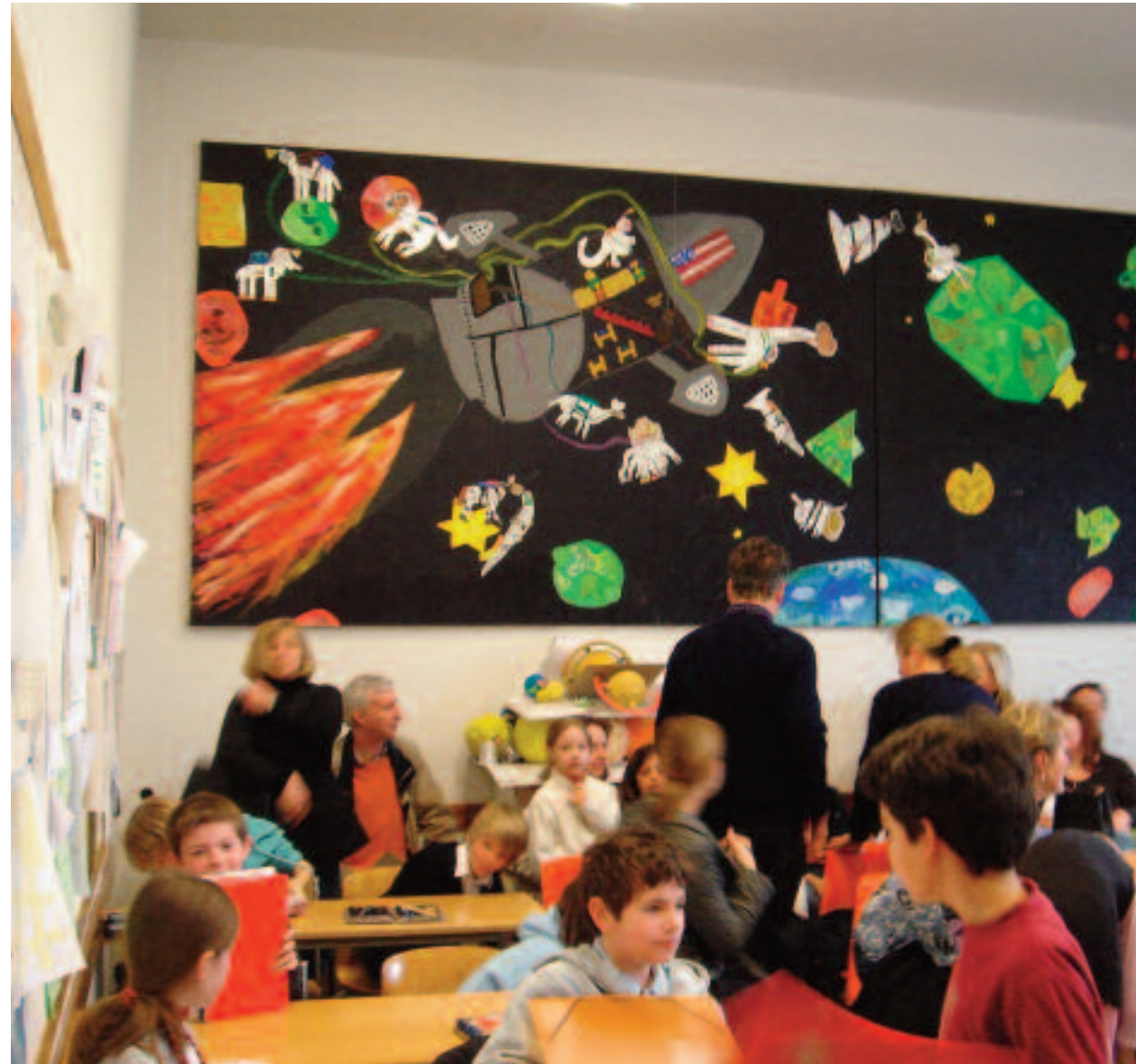
Eltern und Schüler drücken am Tag der offenen Tür gemeinsam die Schulbank